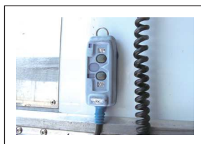
パワーゲートリモコン

※免許証に「準中型車は準中型車(5t)に限る」と記載のある準中型免許では運転できません。 ※車種の指定はできません。※型式により、積載量・車両サイズ等に若干の違いが生じる場合がございます。