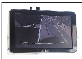
バックアイカメラ