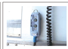
パワーゲートリモコン

※車種の指定はできません。※型式により、積載量・車両サイズ等に若干の違いが生じる場合がございます。