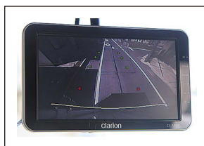
バックアイカメラ